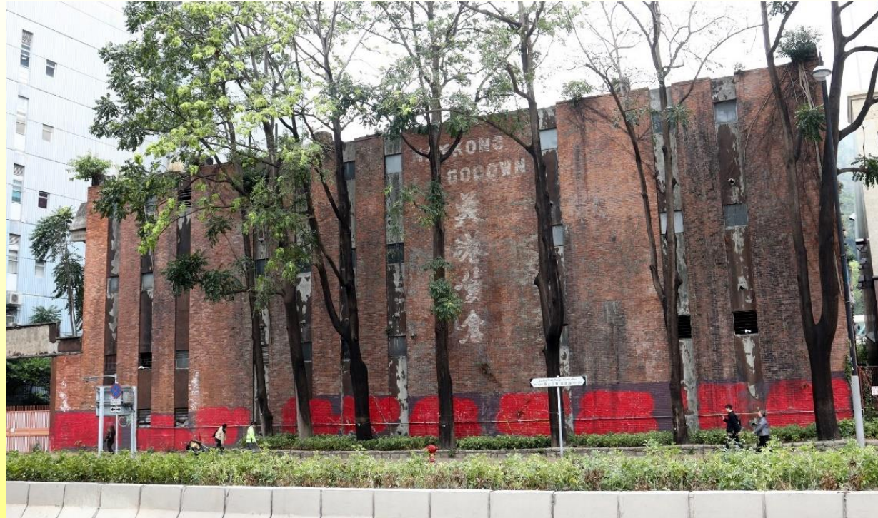
南立面（面向青山公路荃灣段） South elevation (facing Castle Peak Road – Tsuen Wan)