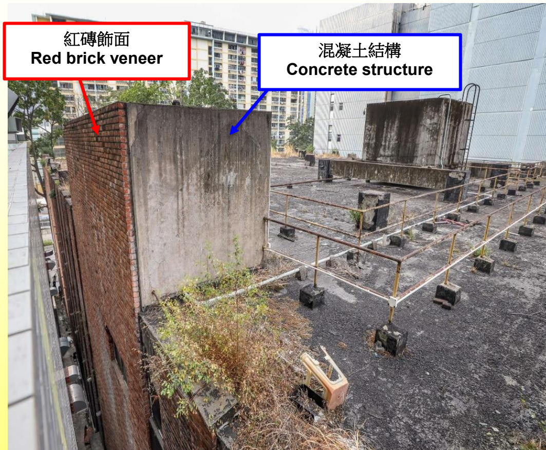
東立面 East elevation