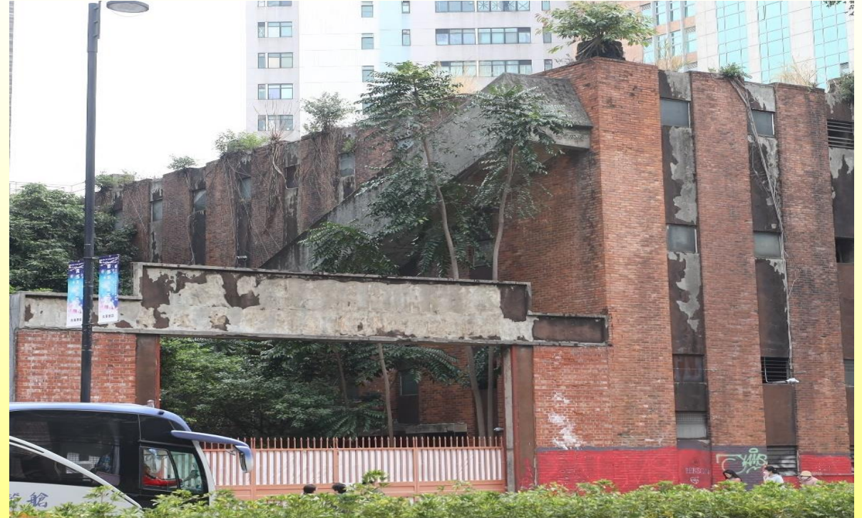
西立面（面向內庭） West elevation (facing courtyard)